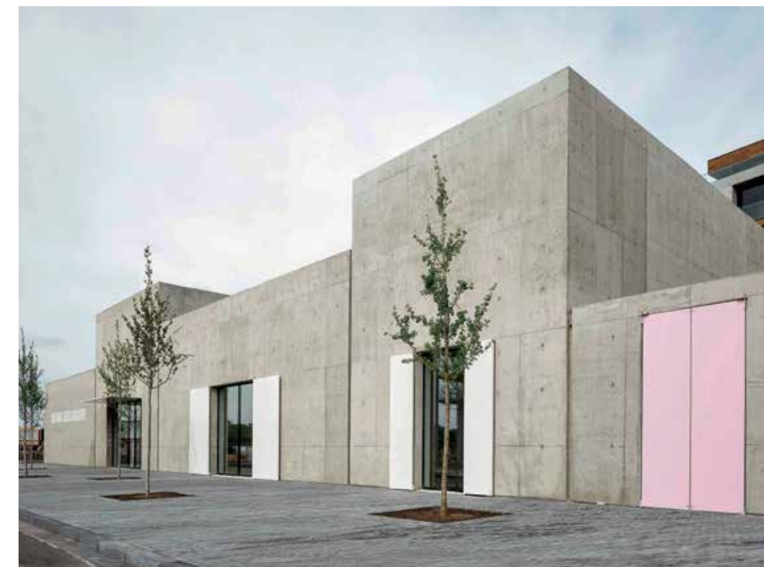
Een stockageruimte, kantoren, een 'white cube,' een 'kapel' en een patio volgen elkaar op.

In vergelijking met de meeste andere gebouwen op Nieuw Zuid is de nieuwe Tim Van Laere Gallery niet hoog. "Dit speelde ook mee in de keuze voor vrij gesloten betonvolumes", legt de architect uit. "De naburige gebouwen rusten op een zware sokkel. Om aan te sluiten bij de omgeving is het gebouw dan ook uitgewerkt als een plint." ▶