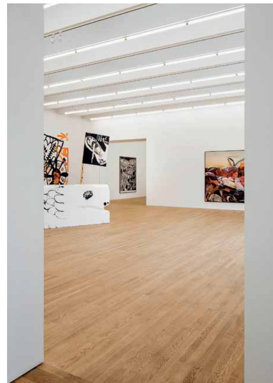
De open nagelgaatjes en het schaafwerk geven de vloer een industrieel tintje, zonder af te doen aan de finesse van eiken parket.

"Ontzorging is de basis van ons concept"