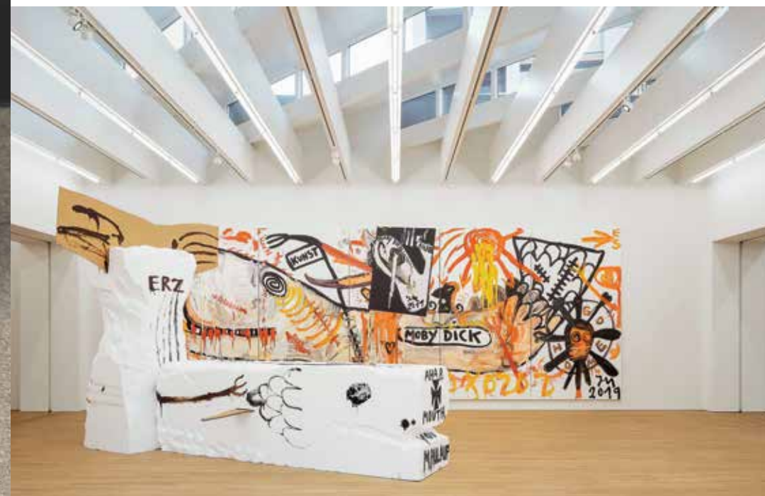
Veel wandruimte is essentieel voor een kunstgalerij.