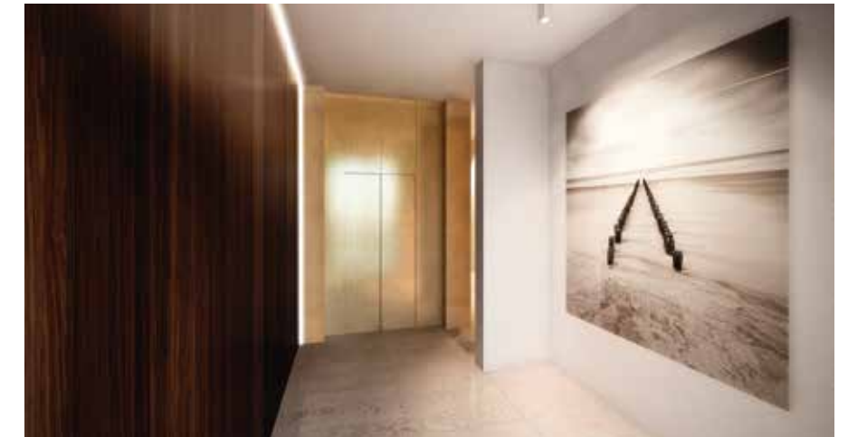
Gezien de nabijheid van de zee werd er in de inkom en de gemeenschappelijke ruimtes gekozen voor keramisch plaatmateriaal.

volledige levering en plaatsing van de gekozen producten is in detail besproken en gevisualiseerd. "We zorgen voor een offerte op basis van de gekozen materialen en de vooropgestelde plaatsing", ➤