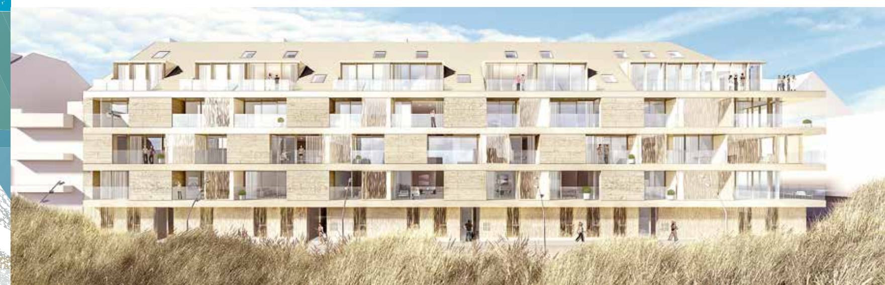
Duin & Park wordt de nieuwe eyecatcher in het bruisende hart van Knokke.